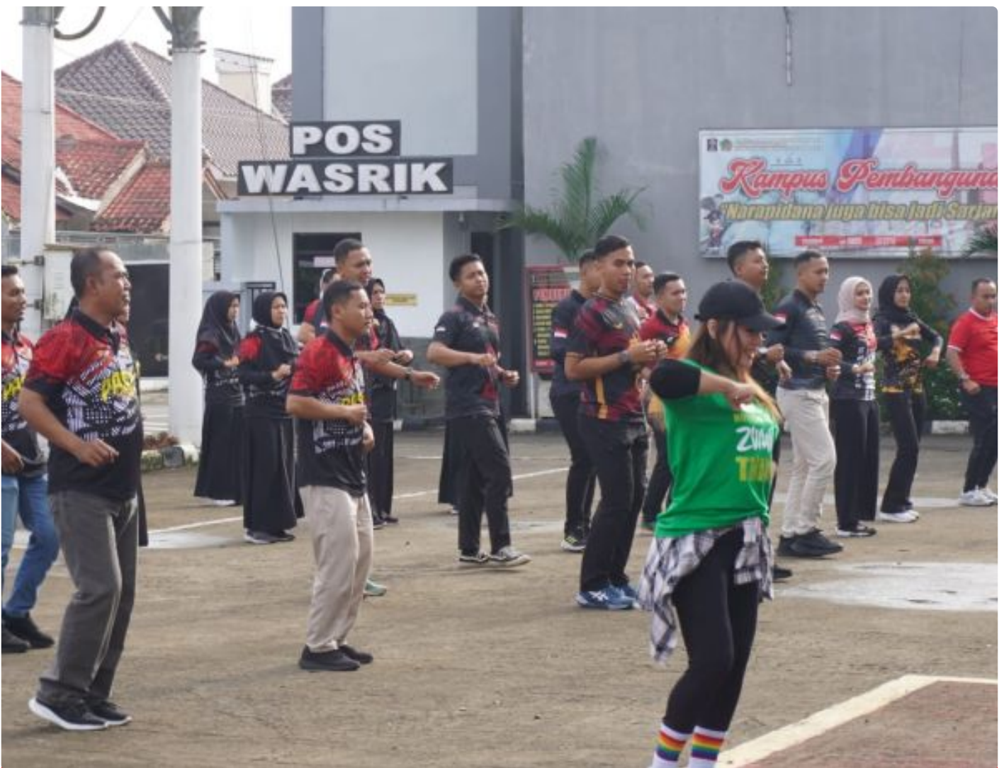
Jaga Kebugaran Tubuh, Pegawai Lapas Kelas IIA Purwokerto Senam Pagi Bersama

PURWOKERTO - Kegiatan senam pagi ini dilaksanakan di halaman gedung utama yang dimulai pukul 07.45 yang dipandu oleh instruktur profesional. Kegiatan ini diikuti oleh Kalapas dan seluruh pegawai Lapas Kelas IIA