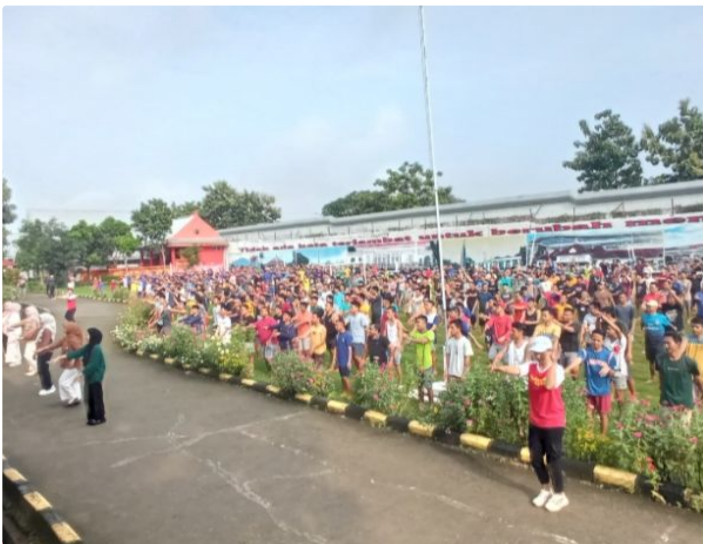
Jaga Tubuh Tetap Sehat, WBP Lapas Kelas IIA Purwokerto Ikuti Senam Pagi Bersama

PURWOKERTO - Dalam mendukung kesehatan jasmani WBP, Lembaga Pemasarakatan (Lapas) Kelas II A Purwokerto adakan senam pagi bagi warga binaan pemsarakatan (WBP). Senam pagi ini dilaksanakan di Lapangan area